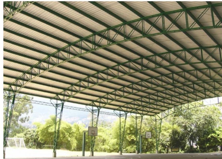
Colegio San José. Cliente: Colegio San José Año: 2004