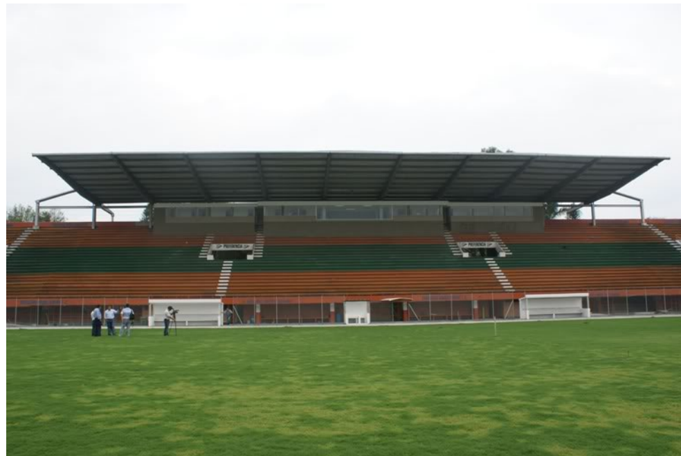
Estadio de Envigado. Cliente: Municipio de Envigado Año: 1997