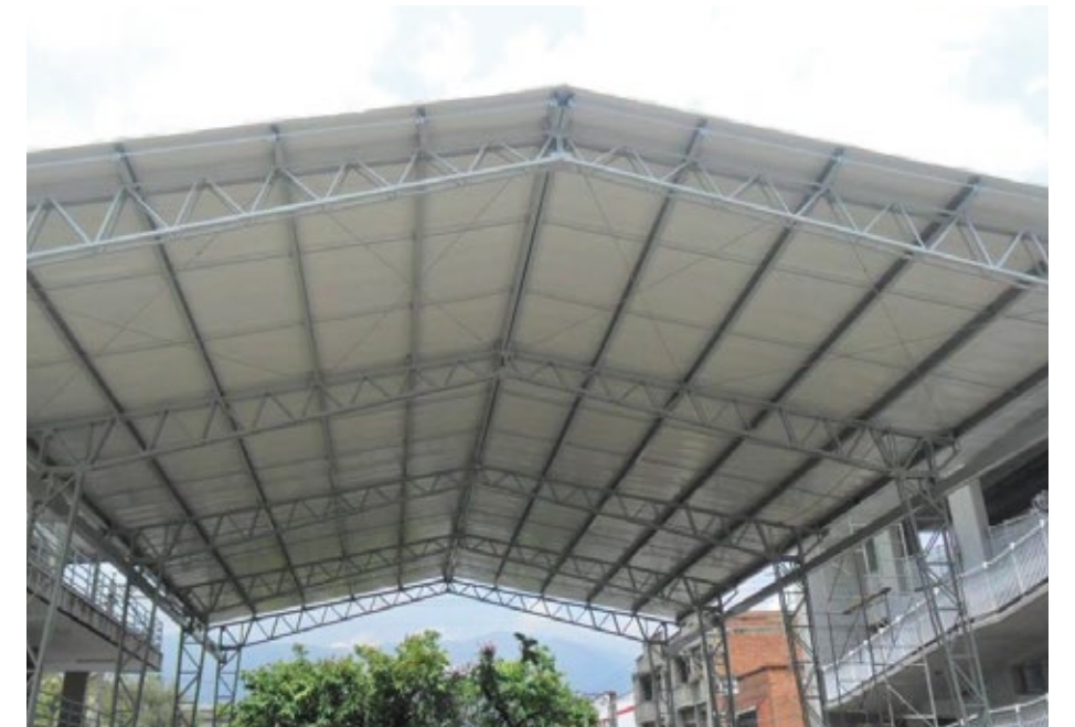
Colegio El Carmelo. Cliente: Colegio El Carmelo Año: 1997